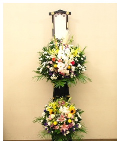
③ 木製スタンド生花(2段) 22,000円 税込