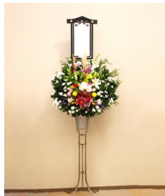
① スタンド生花(1段) 11,000円 税込

ご注文ありがとうございます。お手数ですが FAX の送信と併せましてその旨をお電話でお知らせいただきますようお願い致します。