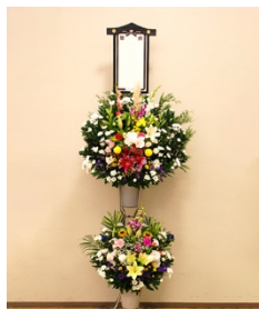
② スタンド生花(2段) 16,500円 税込