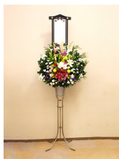
① スタンド生花(1段) 11,000円 税込