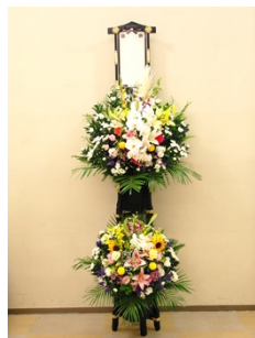
③ 木製スタンド生花(2段) 22,000円 税込