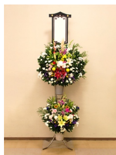
② スタンド生花(2段) 16,500円 税込